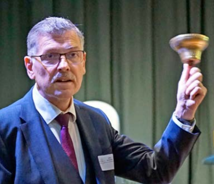
Reinhard Krebs, Landrat des Wartburgkreises