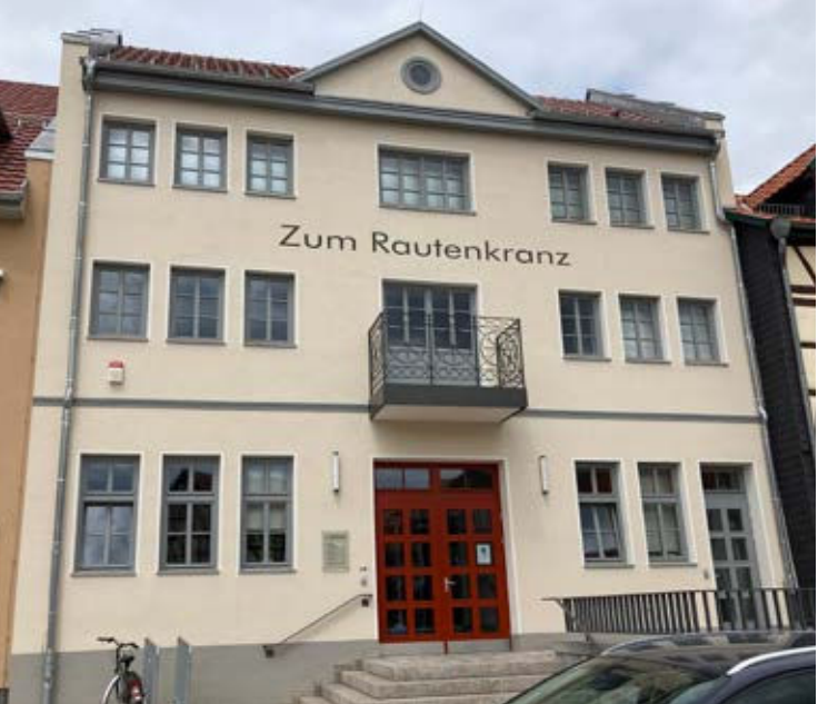
Ort des Geschehens: Zum Rautenkrantz in Gerstungen